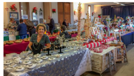
Le marché de Noël