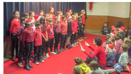
Le Noël des Écoles