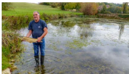
Lâcher de carpes dans l'étang