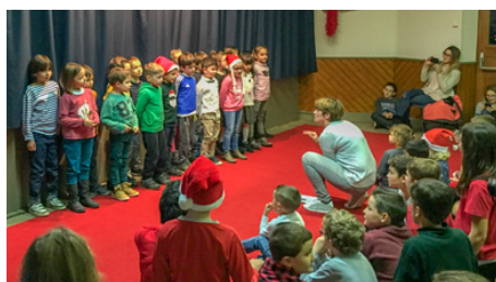
Le Noël des Écoles