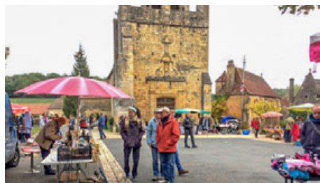
Le vide-grenier d'Octobre