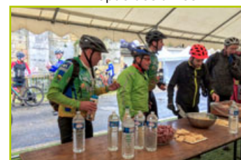
Marathon des forts