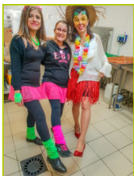
Repas déguisés des écoles