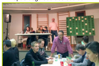
Loto des écoles