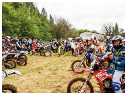
Grappe de Cyrano