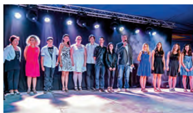
Concours Chanson Française