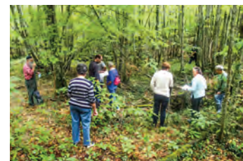
Journée du Patrimoine Le Verteil