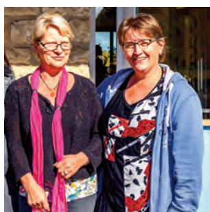
Agents Spécialisés des Ecoles Maternelles ATSEM