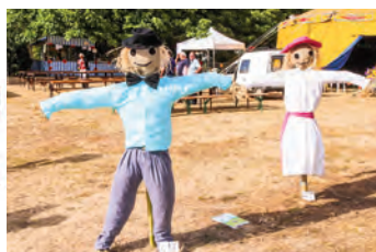
Fête des Épouvantails