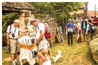
Rando le Chemin des Artistes