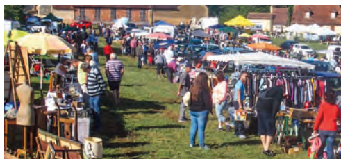
Vide Grenier Carmensac